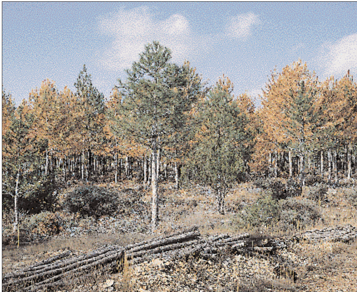
Foto 1.- Ataque producido por Ips sexdentatus debido a la presencia de pilas de madera en el monte.