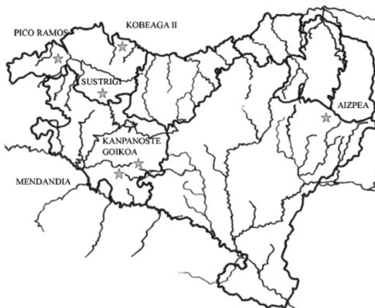
Figura 1. Localización geográfica de los yacimientos citados en el texto

2007-2008). Presentamos aquí un marco cronológico que coincide con los últimos milenios en los que el ser humano mantiene una economía depredadora (cazadores-recolectores). Estas primeras fases del Holoceno representan un notable cambio en su entorno medioambiental. La situación actual de los estudios de macrorrestos en Euskal Herria nos muestran que no se ha realizado análisis sobre estos restos botánicos en todas las zonas biogeográficas, dependiendo del período cronológico existen “vacíos geográficos” de información (IRIARTE et al., 2007-2008). Sin embargo, sí nos permite definir diferentes paisajes dependiendo de la zona a estudiar.