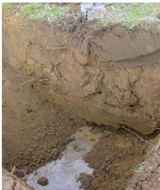
Hoyo para plantación de chopos a raíz profunda en una estación de muy buena calidad.

Los clones ensayados, o en ensayo, son los siguientes: "Agathe F", 'Alcinde', 'Anadolu', 'A2A', 'A3A', 'A4A', 'B-1M', 'Beaupré', 'Belloto', 'Branagesi', 'Campeador', 'Canadá Blanco', 'Canadiense Leonés', 'Dorskamp', 'Escalote' (Salix alba), 'Flevo', 'Florence Biondi', 'Fritzi Pauley', 'Gaver', 'Goulet', 'Guardi', 'Guariento', 'Harvard', 'Hees', 'Hunnegem', 'I-45/51', 'I-114/69', 'I-135/56', 'I-214', 'I-262', 'I-454/40', 'I-455', 'I-488', 'Italica', 'Koster', 'Luisa Avanzo', 'Lux', 'MC', 'Neva', 'NNDv', 'Ogy', 'Onda', 'Orba', 'Pinseque', 'Polargo', 'Primo', 'Raspalje', 'San Martino', 'Sanosol', 'Ticino', 'Trebba', 'Triplo', 'Unal', 'USA 49-177', 'USA 184-411', 'USA 198-565', '1-z', '48-Jacquometti', '2000 Verde'.