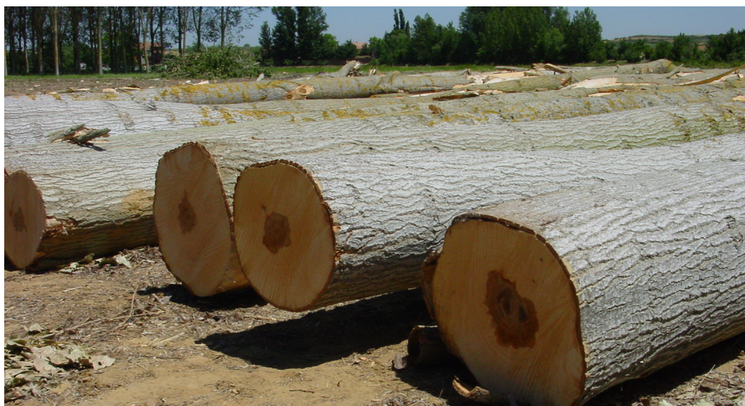
Trozas de 'I-214'.

En lo que se refiere a la densidad de la madera, los clones que presentan una alta densidad son: 'Agathe F', 'Anadolu', 'Bordils', 'Lombardo Leonés', 'Lux' y 'MC'. Tienen densidad media los clones: 'Beaupré', 'Boelare', 'Dorskamp', 'Flevo', 'Guardi', 'Luisa Avanzo', 'I-454/40', 'Raspalje', 'Triplo' y 'Unal'. Y la madera es de densidad baja en: 'b-1M', 'Branagesi', 'I-214' e 'I-488'.