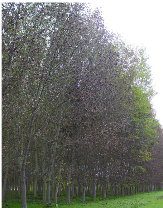
Chopera atacada por Phloeomyzus passerinii .