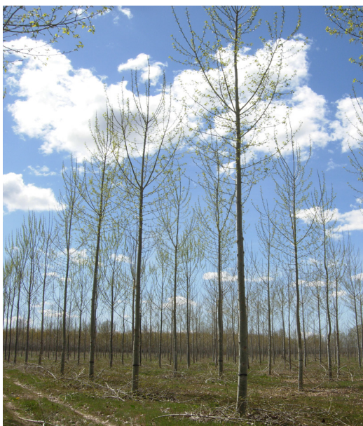
Clon 'Raspalje' en el ensayo de Vega de Infanzones (León)