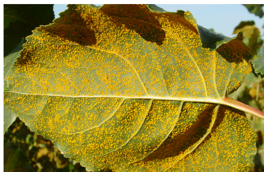
Hoja con Melampsora allii-populina .