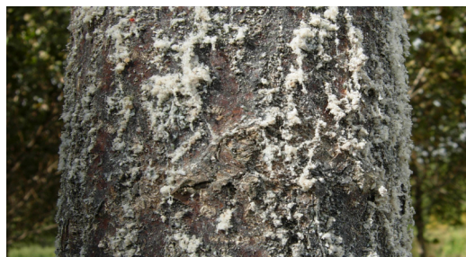
Tronco con Phloeomyzus passerinii .

La elección de clones concretos tiene poca incidencia como tratamiento preventivo de los daños causados por las plagas del grupo "otros insectos". Del resto de los patógenos mencionados, en la cuenca del Duero deben tenerse en cuenta, por su incidencia: Venturia populina , Melampsora larici-populina , Marssonina brunnea , Dothichiza populea y Phloeomyzus passerinii . Los clones del Catálogo Nacional que encuentran un factor limitante para su cultivo en alguno de estos patógenos son: