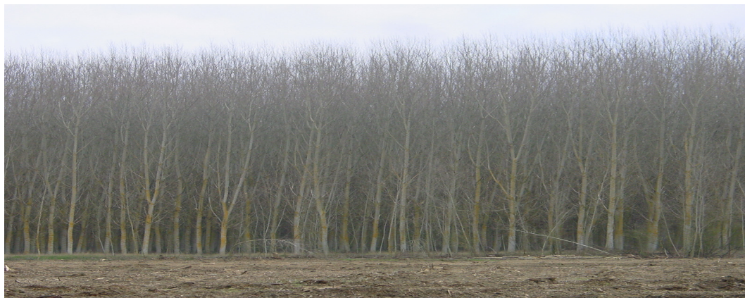
Aspecto de chopera de 'I-214' en la que no se efectuaron podas. Los trocos son sinuosos y están bifurcados.

Las ventajas que presenta 'I-214' justifican sobradamente su utilización en la popicultura de la cuenca del Duero. Sus inconvenientes, por su parte, inducen a plantear la diversificación de clones en el conjunto de la popicultura de la región.